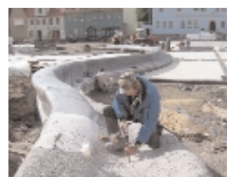
Sofaelemente im Werk, bei der Anlieferung und in Bearbeitung