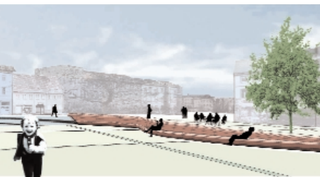
Der Neue Marktplatz in der Animation von Dirk Seelemann