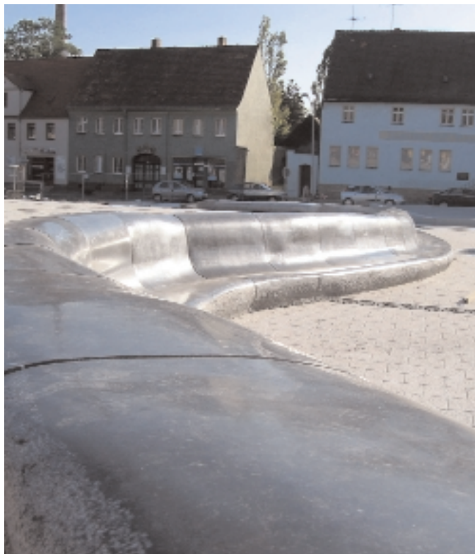
Robust und elegant zugleich: „Steinsofa“ als Gliederungselement des Marktplatzes von Schkeuditz